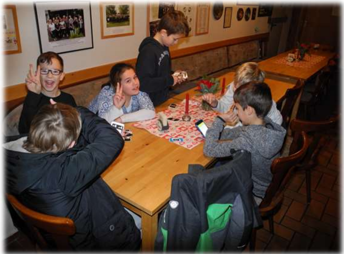
Die Wartezeiten werden mit Kartenspielen ( UNO ) überbrückt.