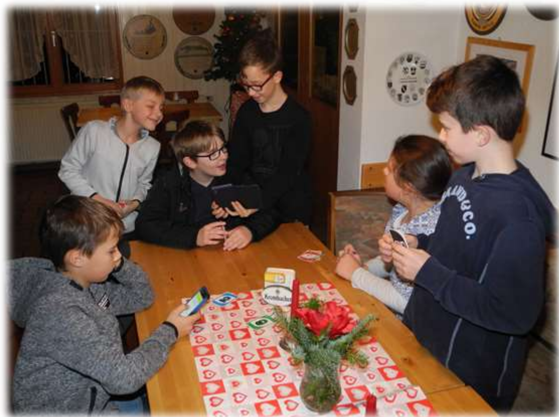
Das Smartphone ist natürlich auch immer gefragt.