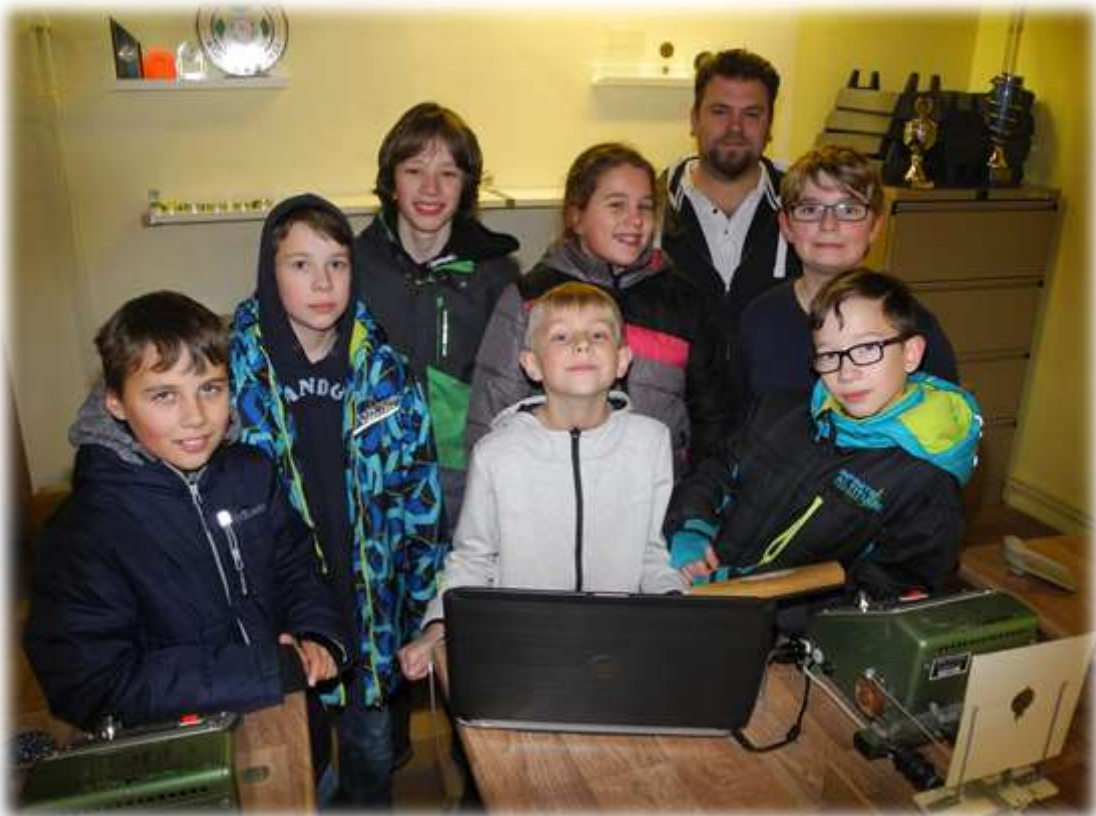
Die Jugendabteilung von 1888