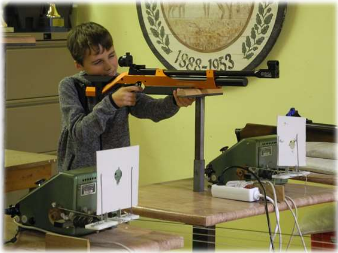
...bevor man am Lasergewehr abdrückt.