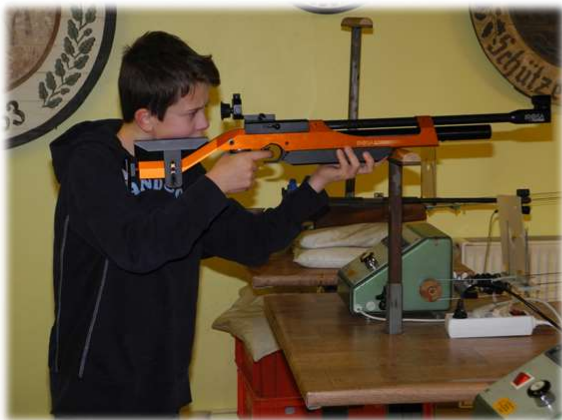
Es wird hier mit dem Lasergewehr stehend aufgelegt geschossen.