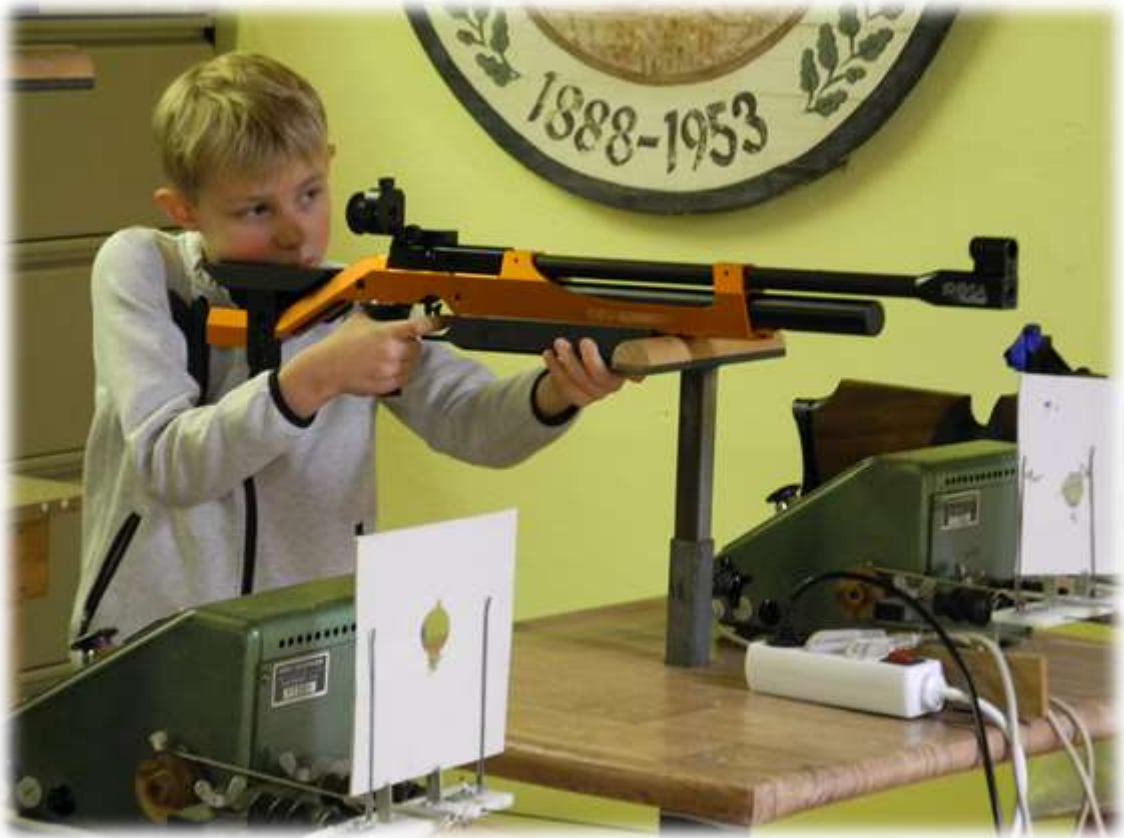
Die Gewehrhaltung ist hier schon vorbildlich...