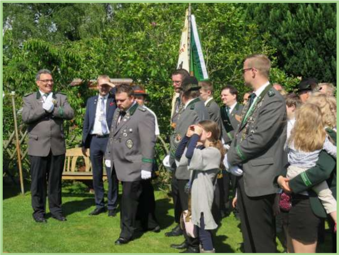
Vortreten zum Scheibenanbringen