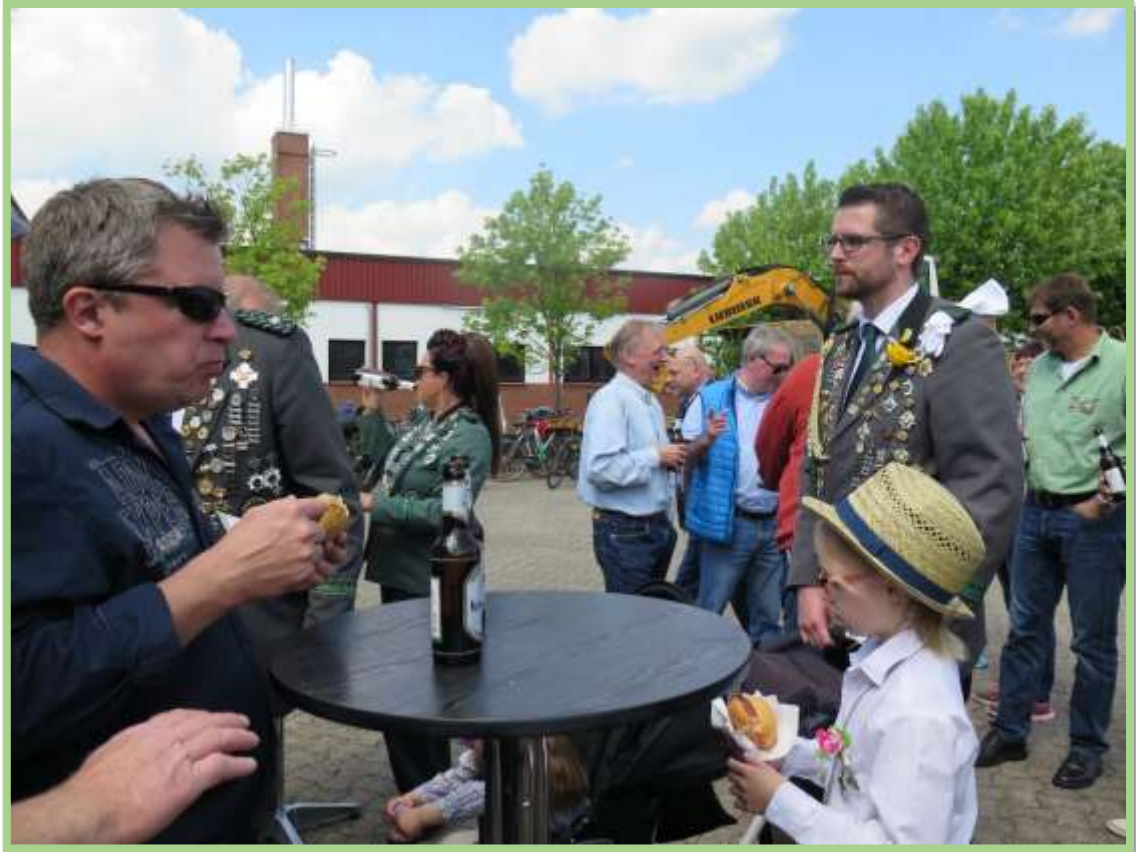
...dazu ein Bierchen