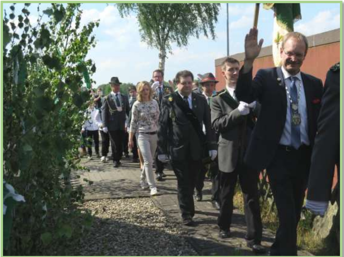
...und gleich hinter das Haus und ab in den Garten