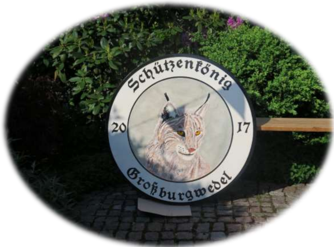
Die Königsscheibe steht bereit