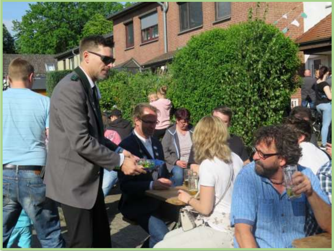
Die Sitzplätze zum Ausruhen waren begehrt...