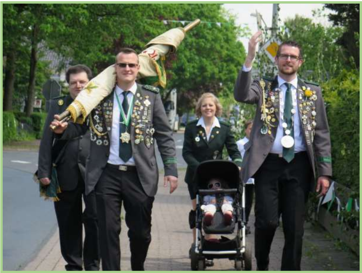
Mit Schützenfahne zum Antreten