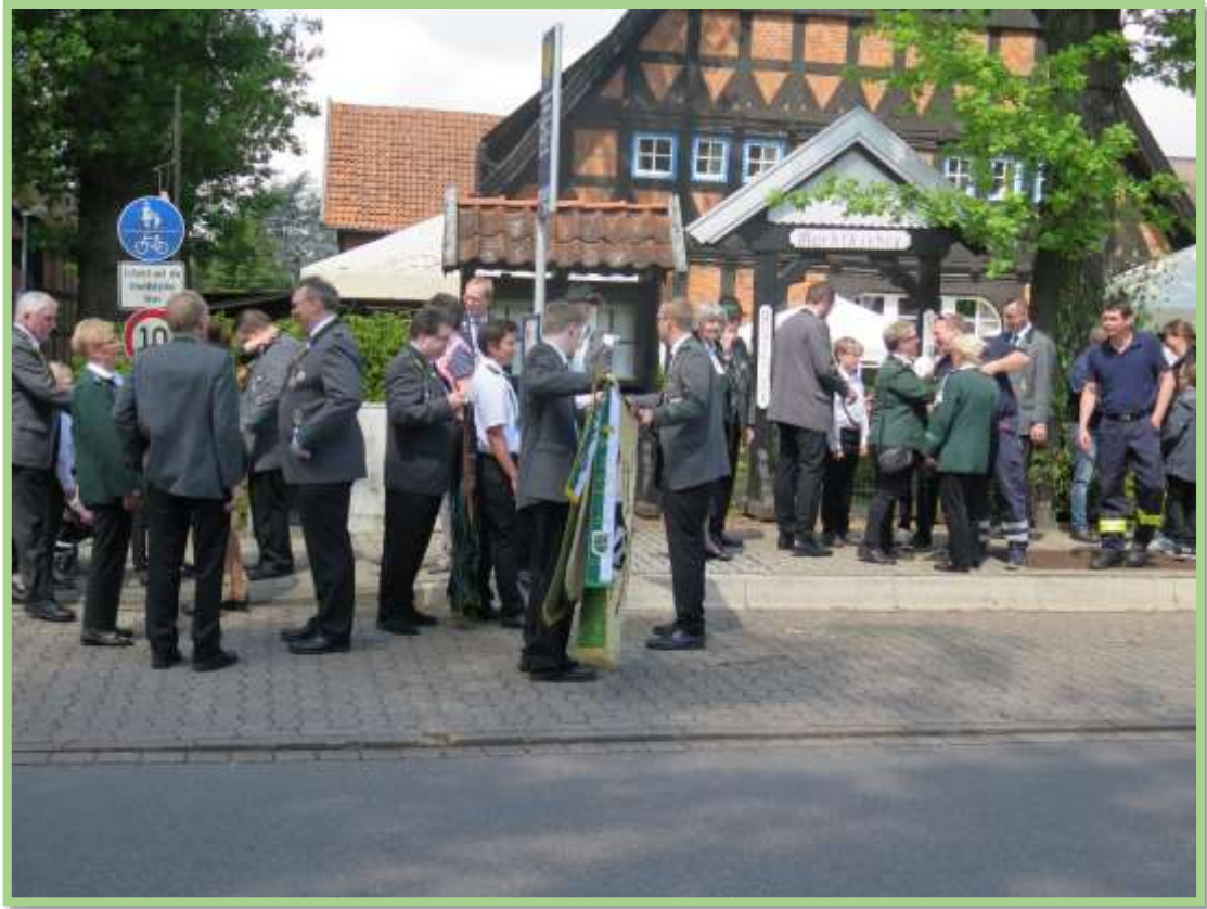
Samstag, den 20. Mai 2017