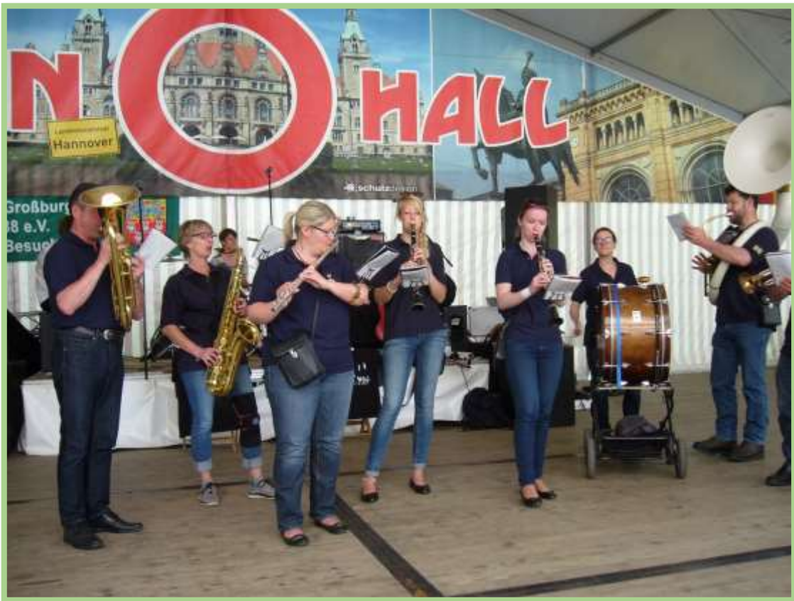
Im Zelt wurde noch mal musikalisch aufgespielt