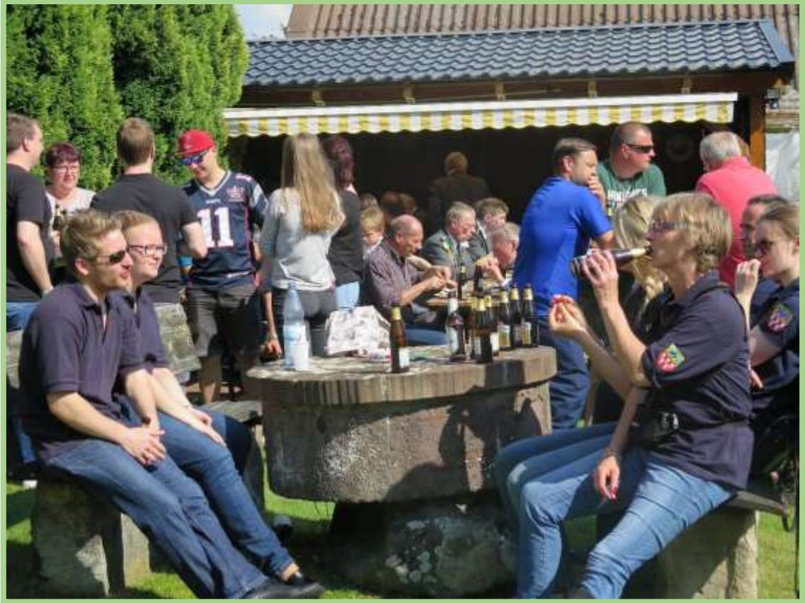
...und nochmal ein Bierchen