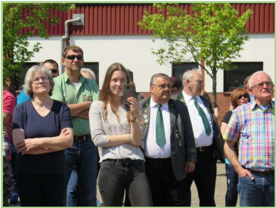
...man lauscht seinen Worten