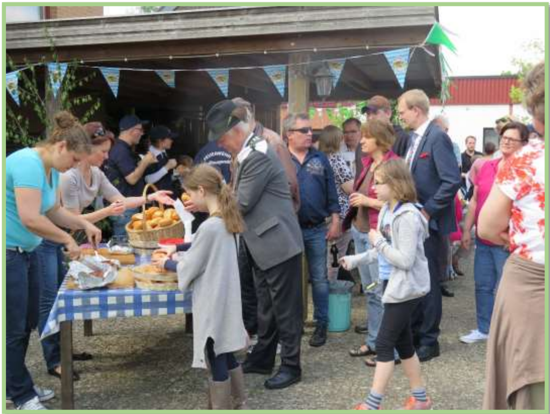
Alle Gäste werden...