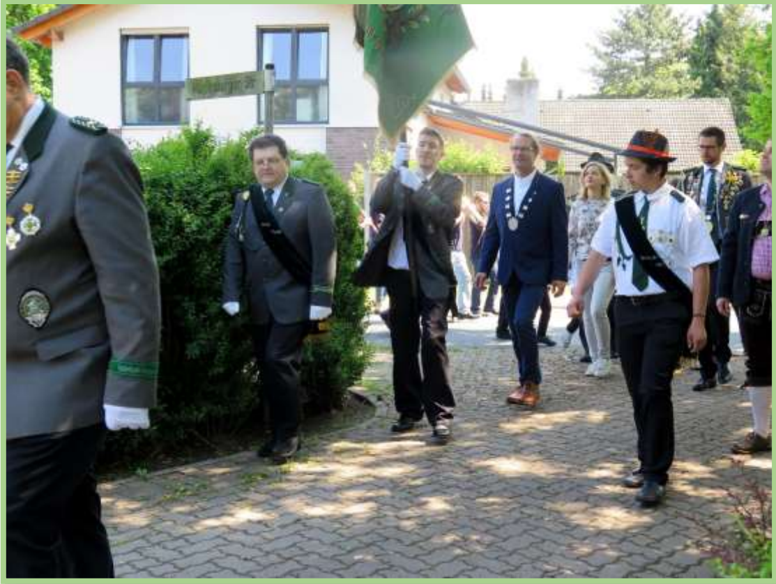
...bevor man zum Bürgerkönig aufbricht