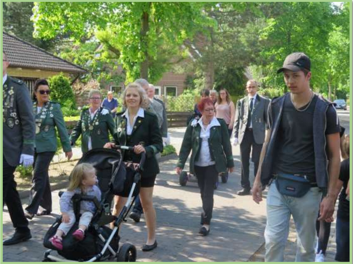
...in Richtung Ortsausgang zum Jungmannenkönig