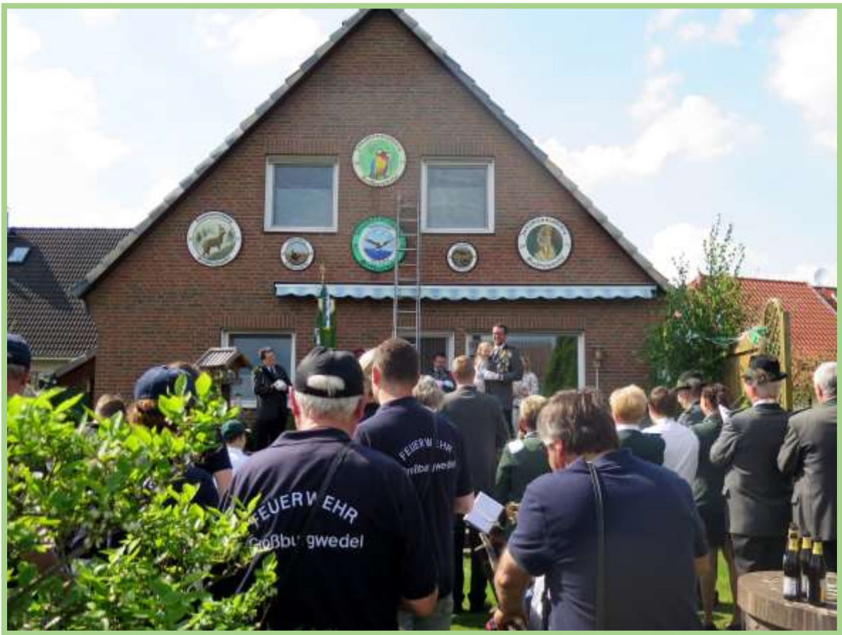
...und den sechs Scheiben am Hausgiebel