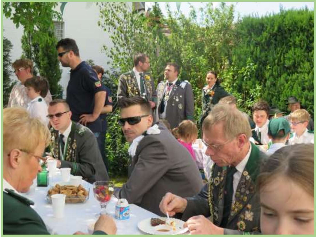
Süßigkeiten u. Kekse sind aufgetischt