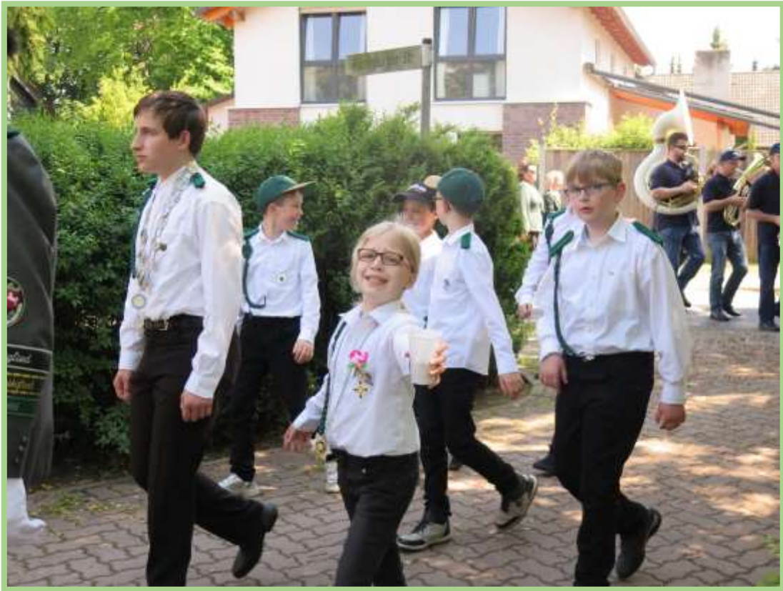
Hier unsere Jugendlichen Vereinsmitglieder