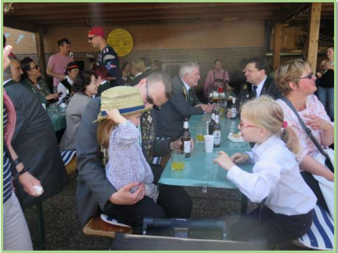
...und Saft für die kleinen Gäste