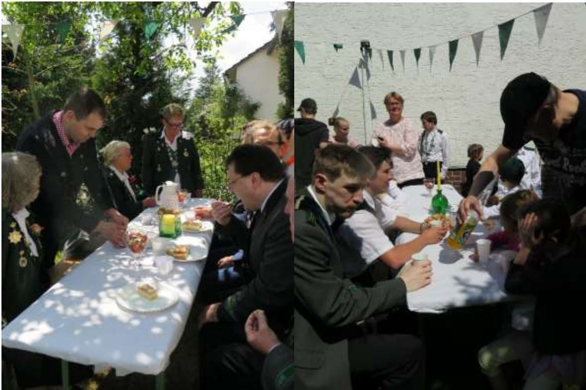
...um mit Butterkuchen u. Brause zu feiern