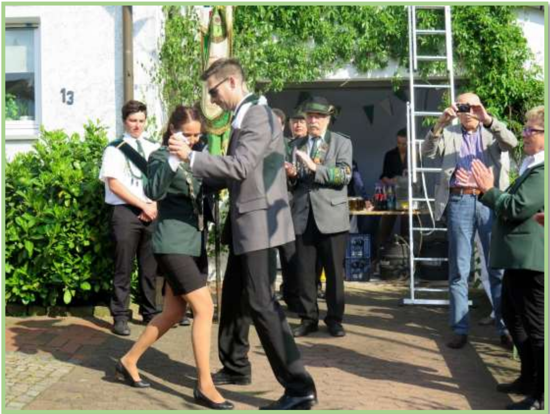
1888 und gleich Schützenkönigin im Verein !