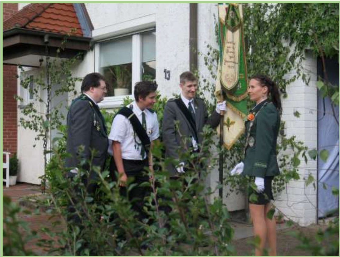
...in der Feldstraße 13 das Ziel