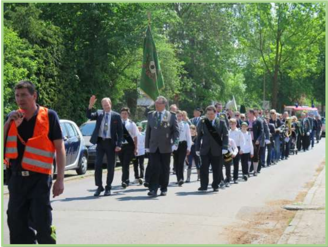
An der Spitze des Zuges der Ortsbürgermeister u. der 1. Vorsitzende von 1888