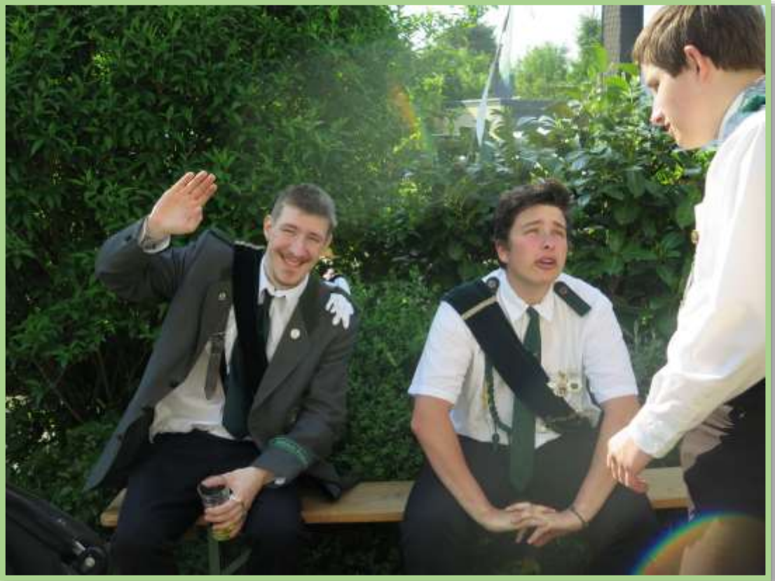
...nach dem langen Marsch - sogar bei den Jugendlichen