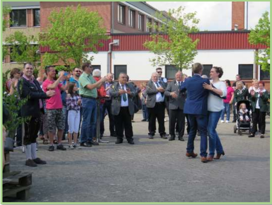
...im Hofe des Anwesens