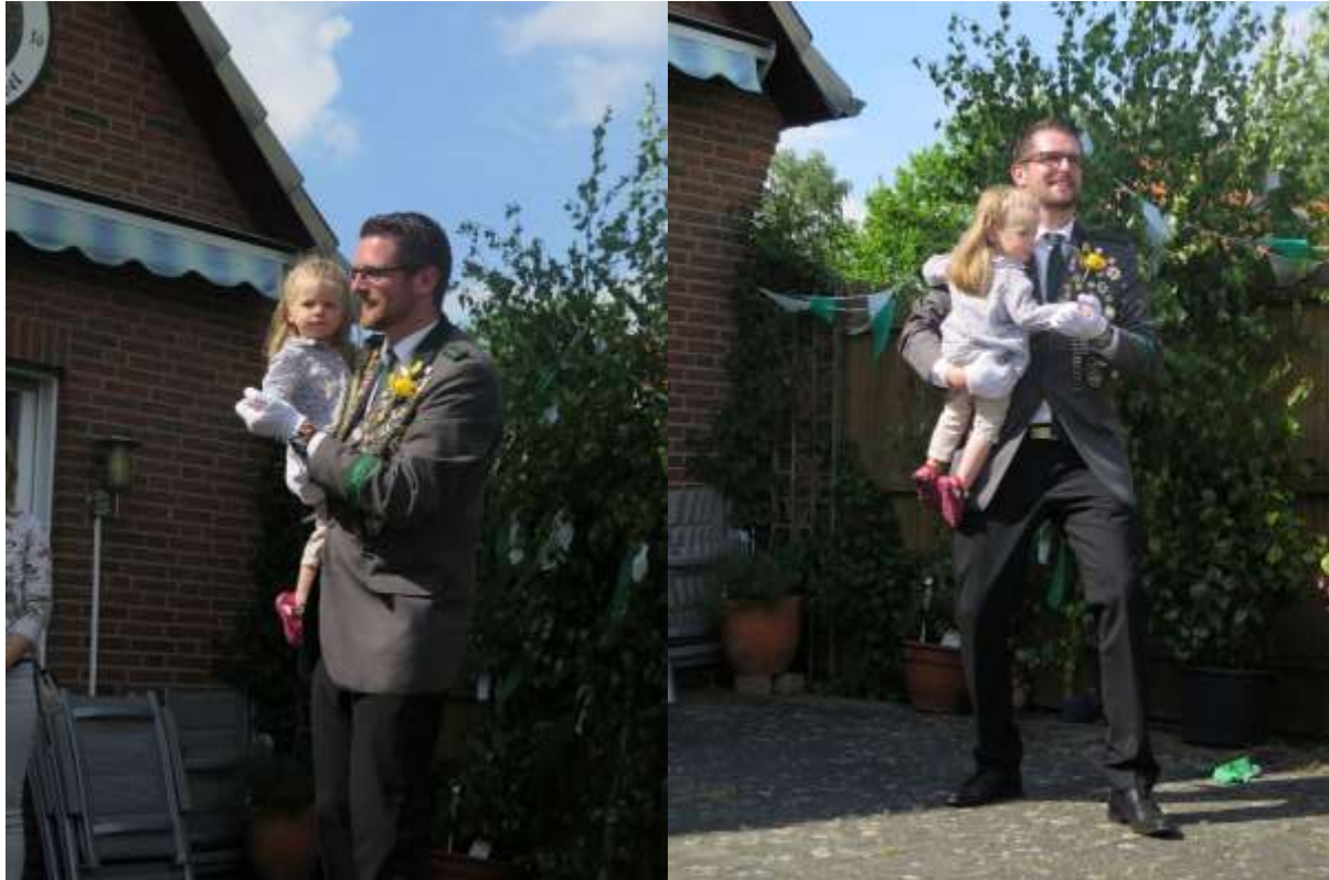
Ehrentanz mit der jüngsten Freundin