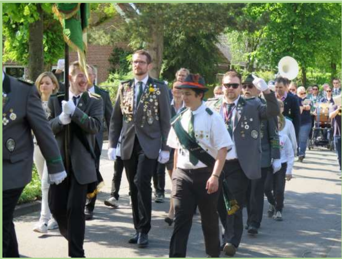
Nun geht's zum Jungmannenkönig