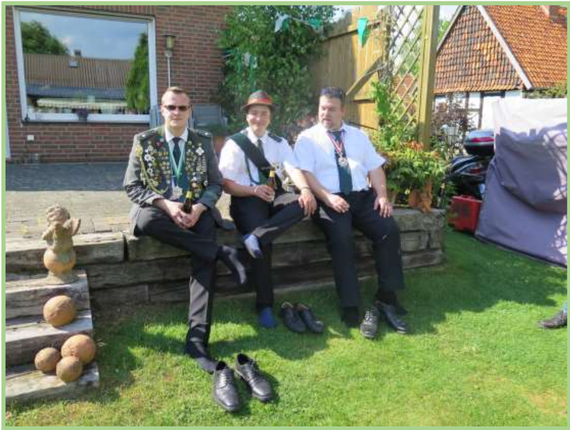
...die Socken qualmen ja schon vom vielen Laufen !