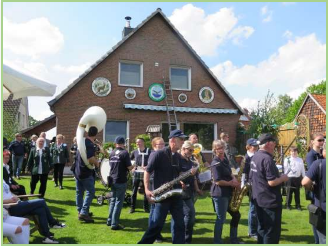
Bei Feyerabend's hängen schon 5 Scheiben ( 2 Kinder + 3 Jungmann )