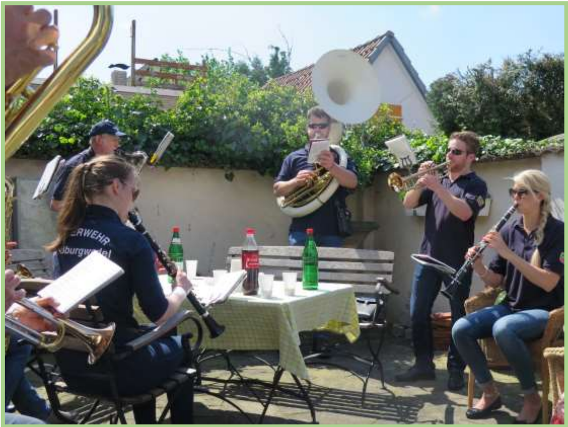
Der Musikzug der FFW gibt „Ein Ständchen“