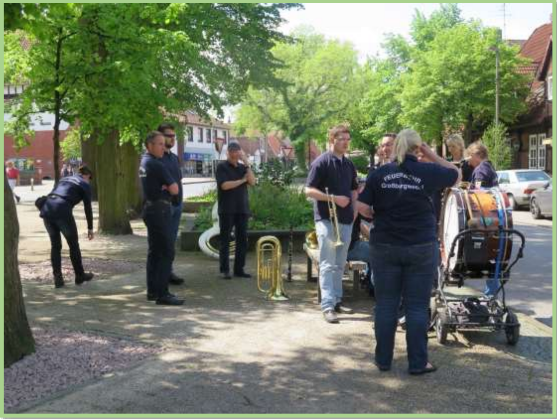
Der Musikzug der Freiwilligen Feuerwehr begleitet...