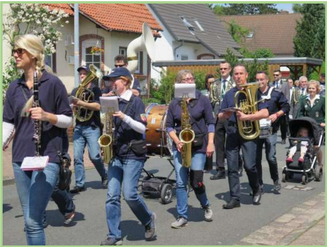
Unsere jüngsten Fans sitzen noch in der Kinderkarre