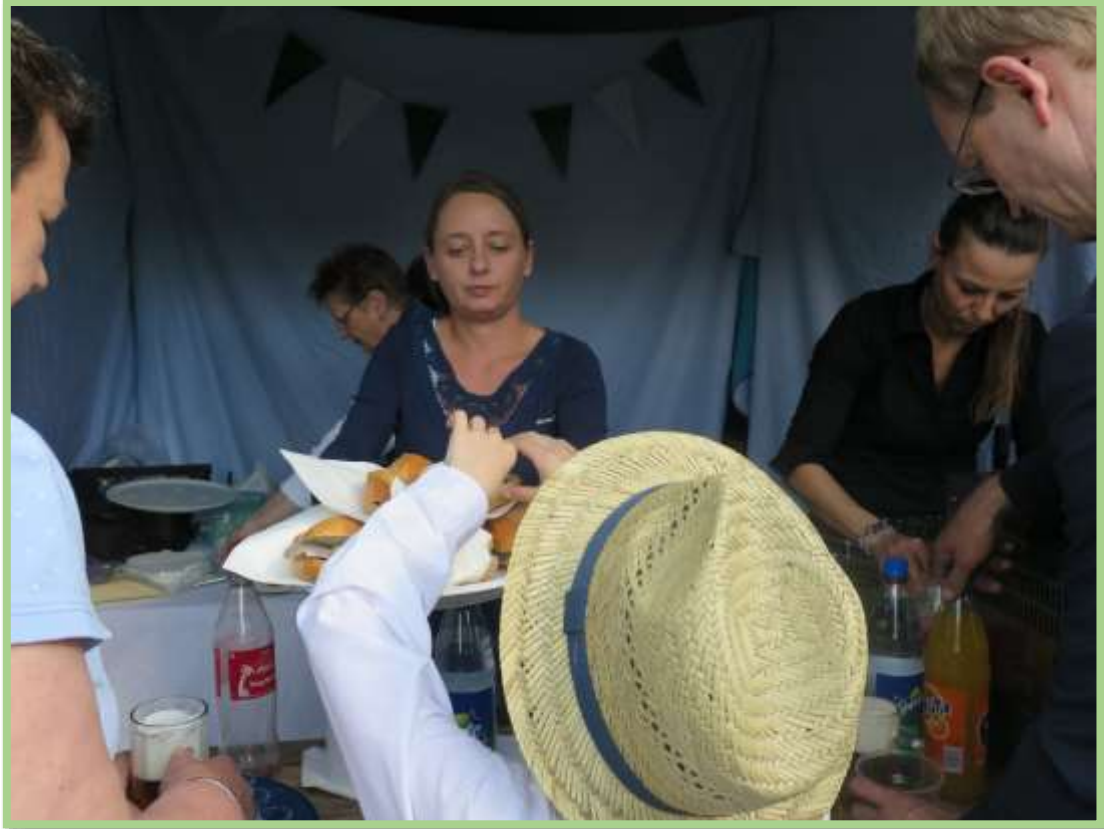
Es gab tolle, herrliche Matjesbrötchen