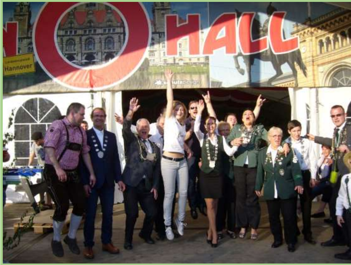
Party, Party, Party