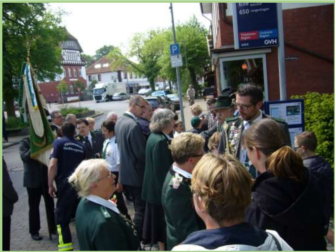
Treffpunkt ist: „Am Markt“