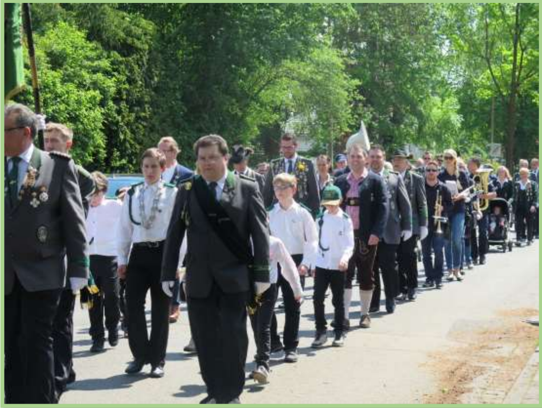
Die erste Scheibe wird beim Kinderkönig angebracht