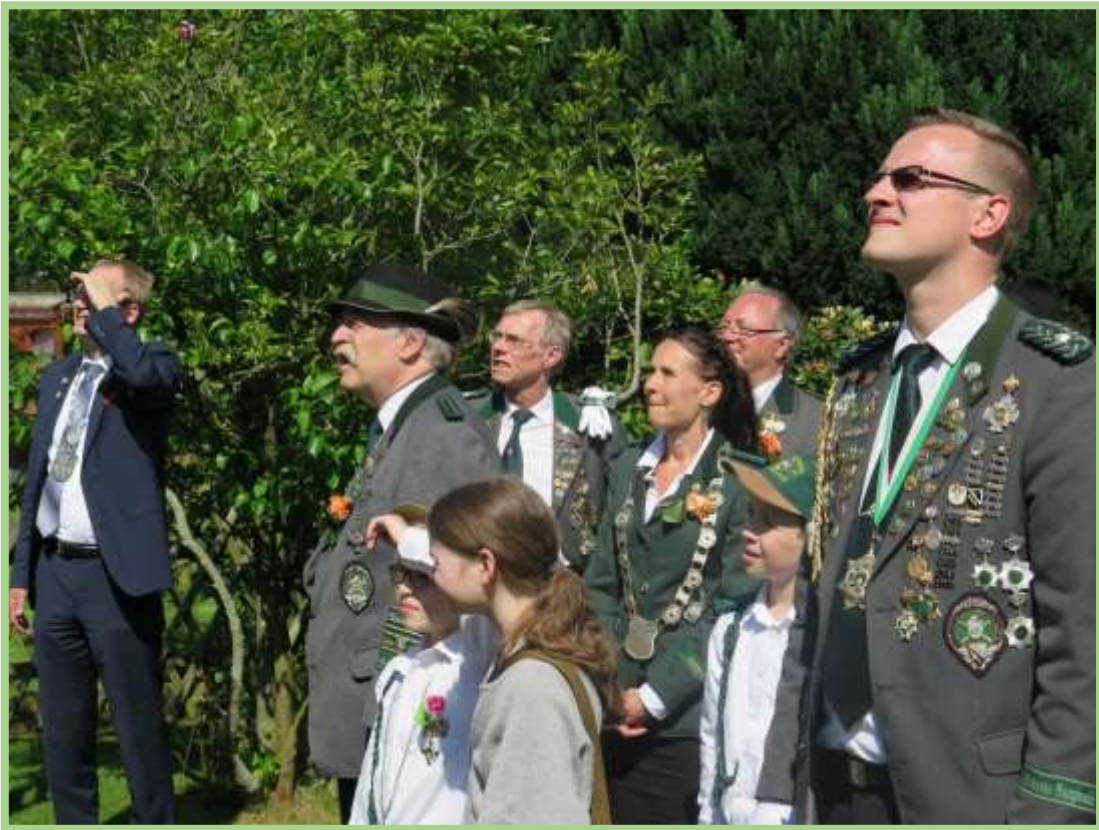
Alle staunen über den...