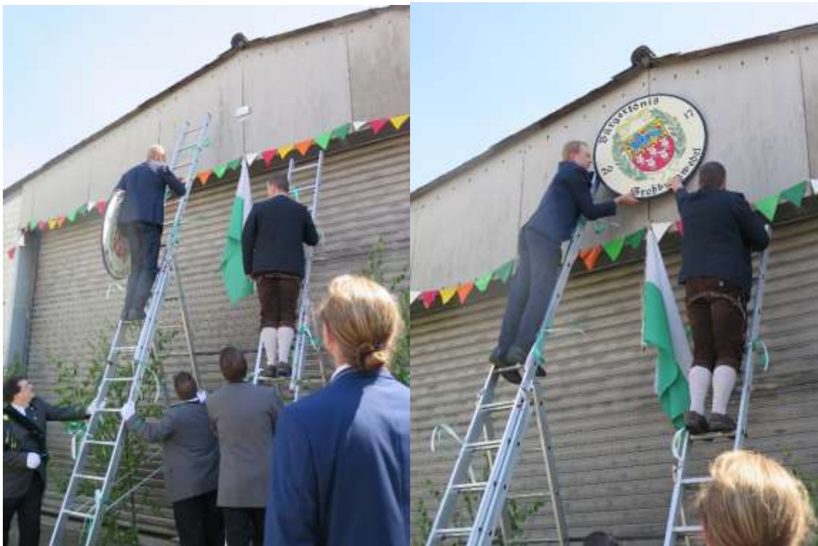
...um das Scheibenanbringen zu begutachten