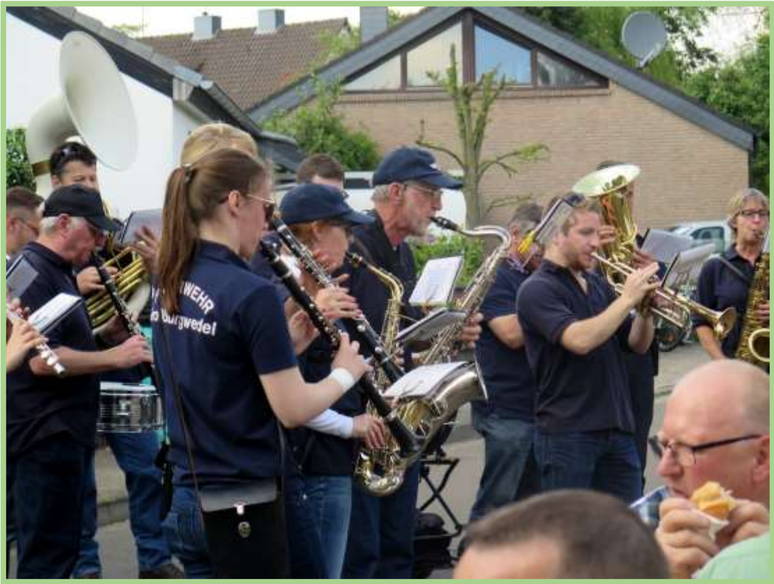
Platzkonzert in der Feldstraße