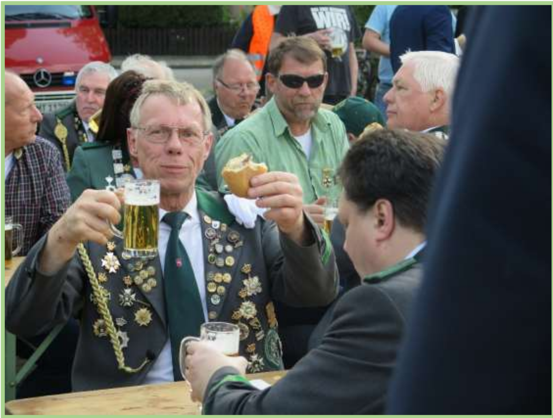
...und gezapftes Bier