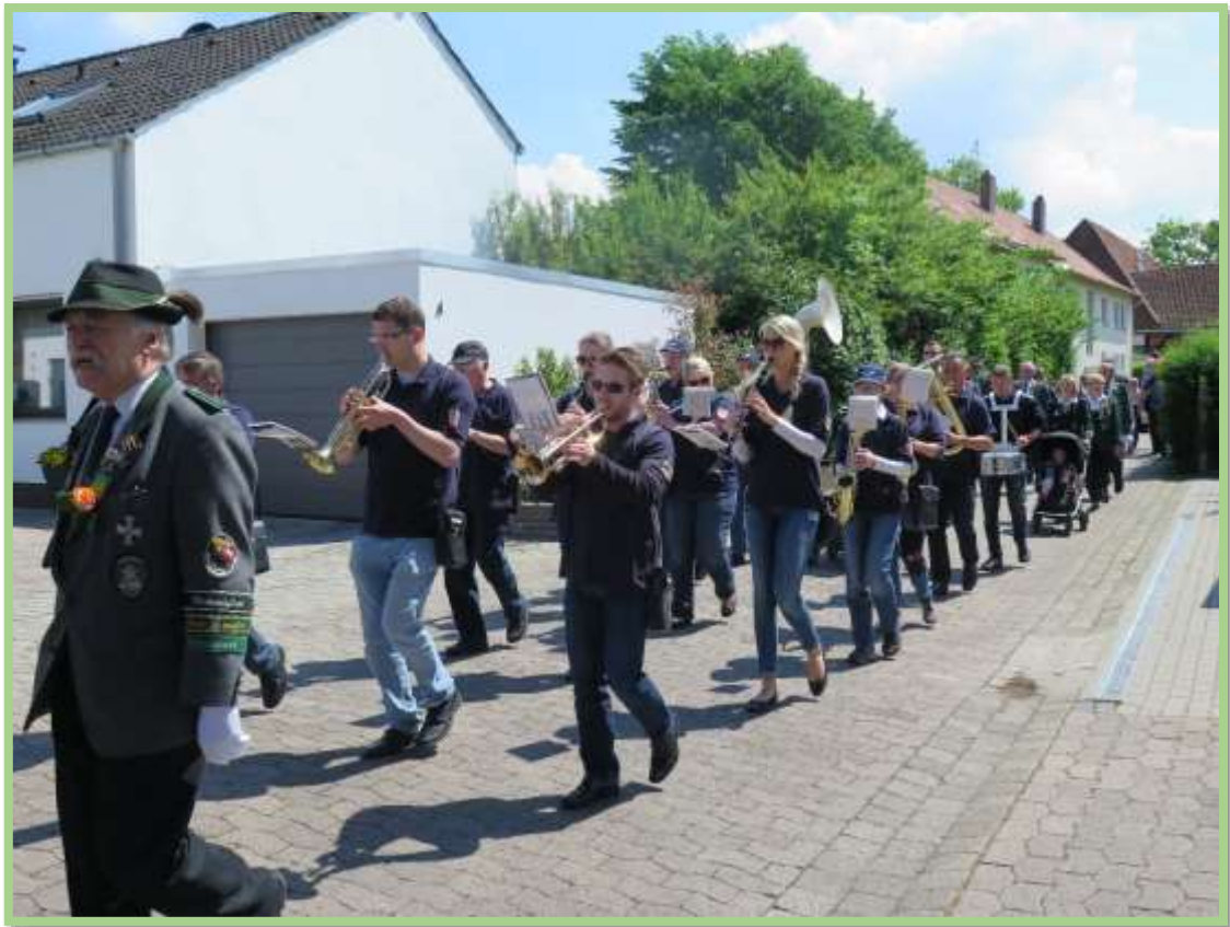
...den Schützenumzug musikalisch...