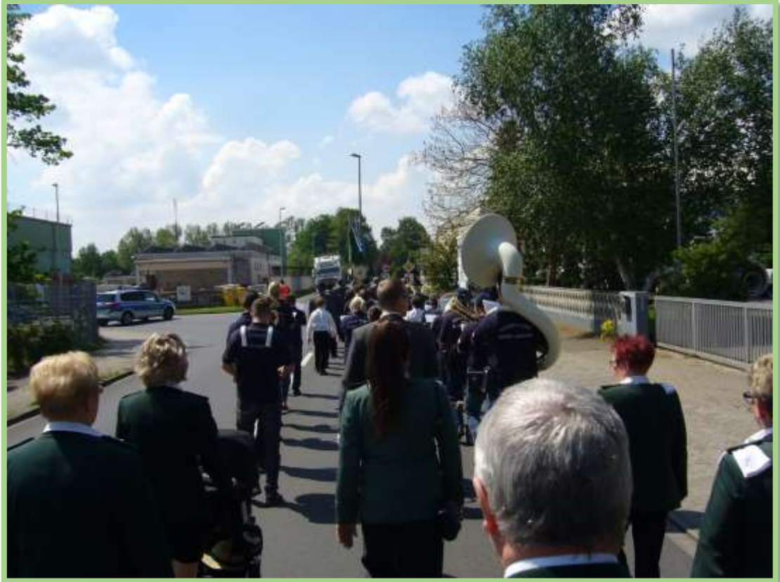
Das Wetter in Burgwedel ist hervorragend