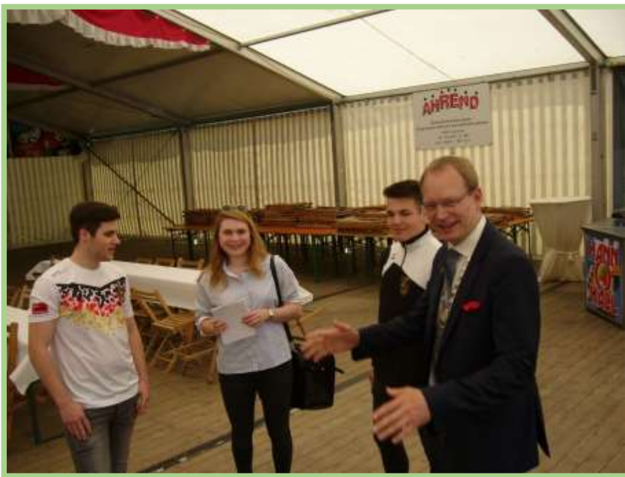
Parallel zum Scheibenanbringen wird...