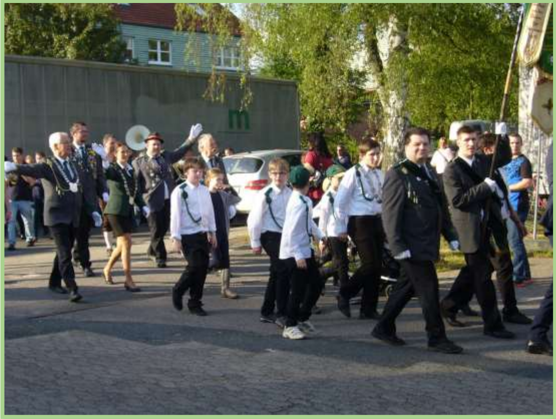
Der Einmarsch auf den Schützenplatz