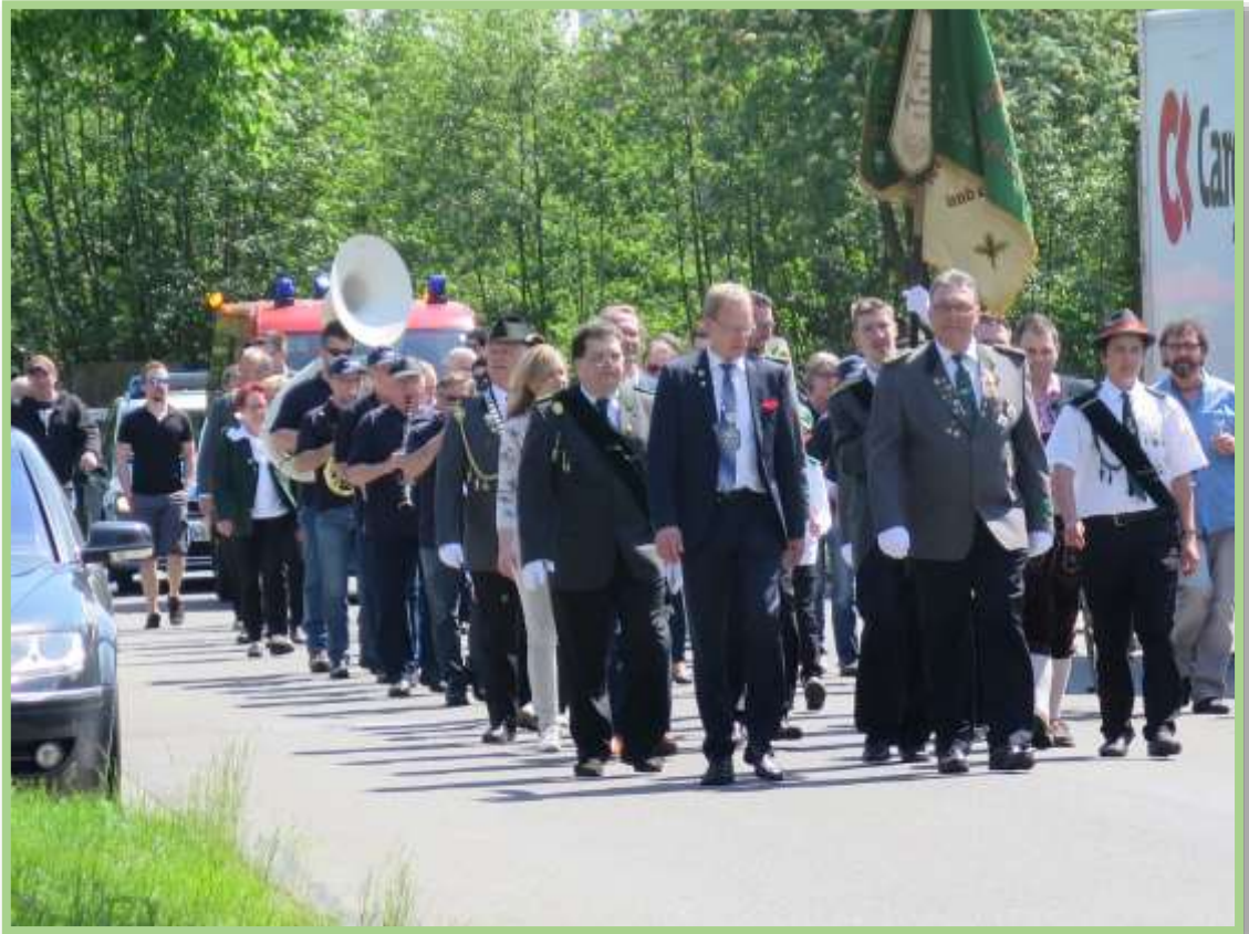
Mit Musik marschiert man auf den Hof...