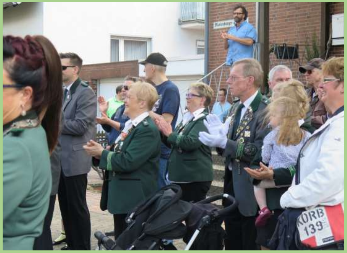
...unter dem Beifall der aktiven Schützenmitglieder