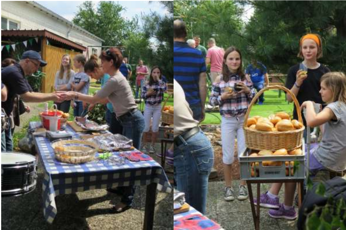
...mit Speis & Trank versorgt