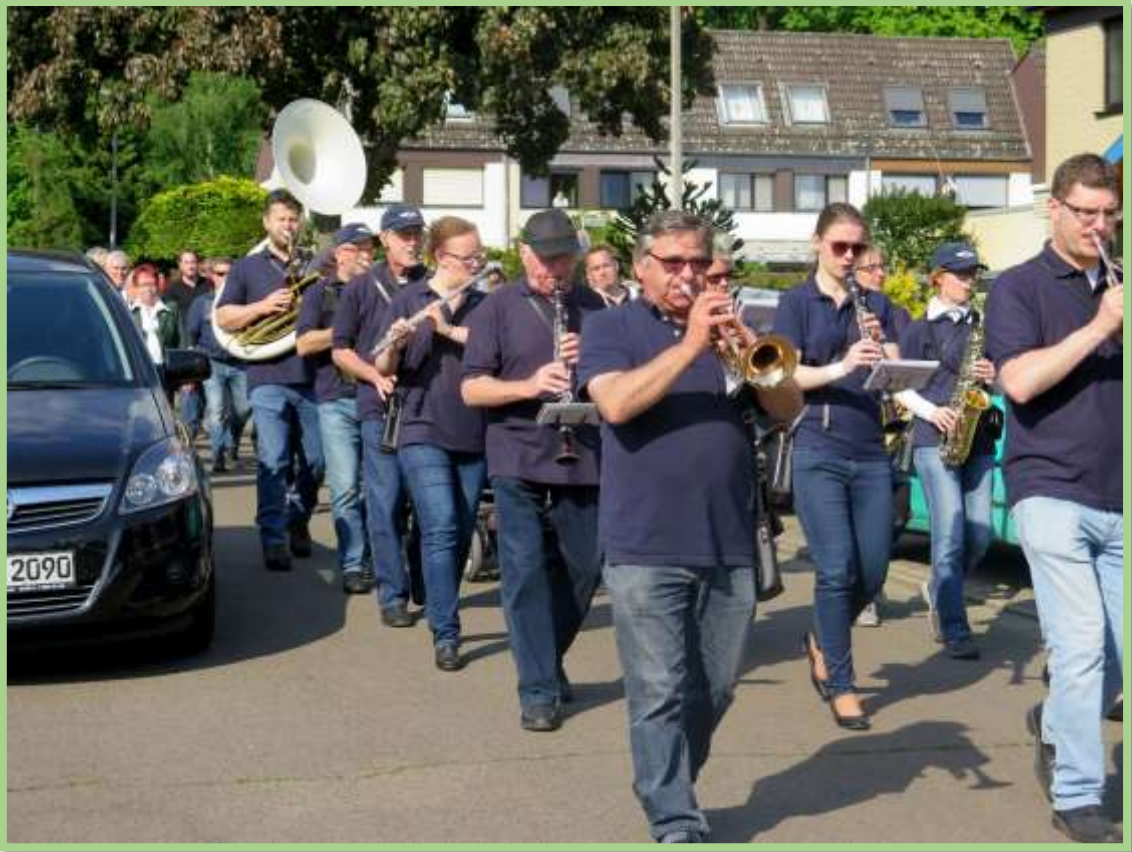
Mit Blasmusik erreicht man...