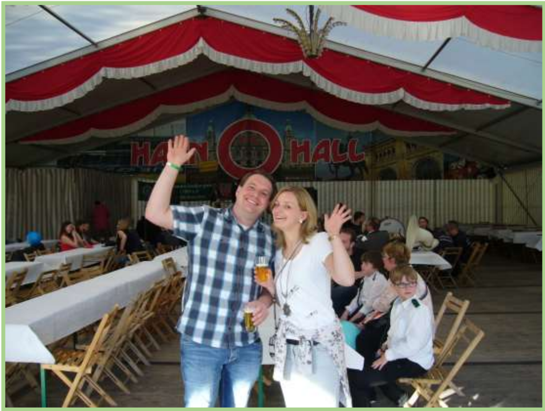
Im Festzelt ab 19.00 Uhr mit der Burgwedeler Band „That's Why“