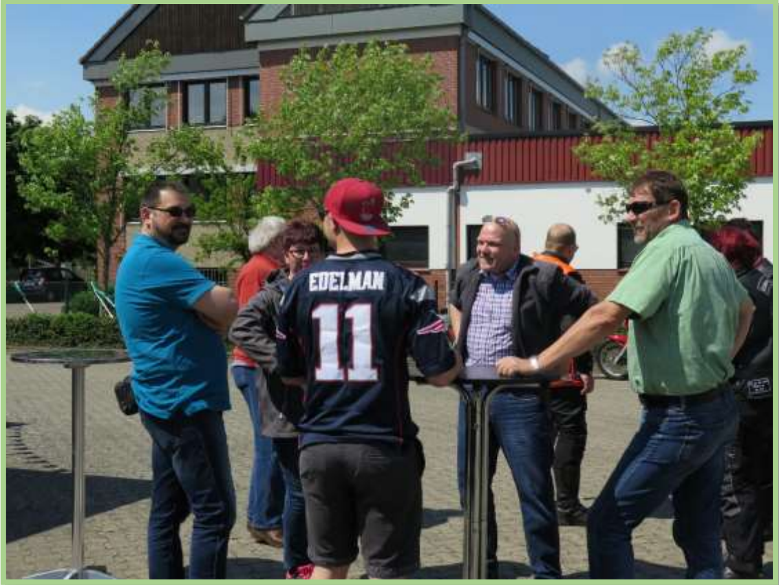
...und auch Freunde von der Feuerwehr sind mit dabei