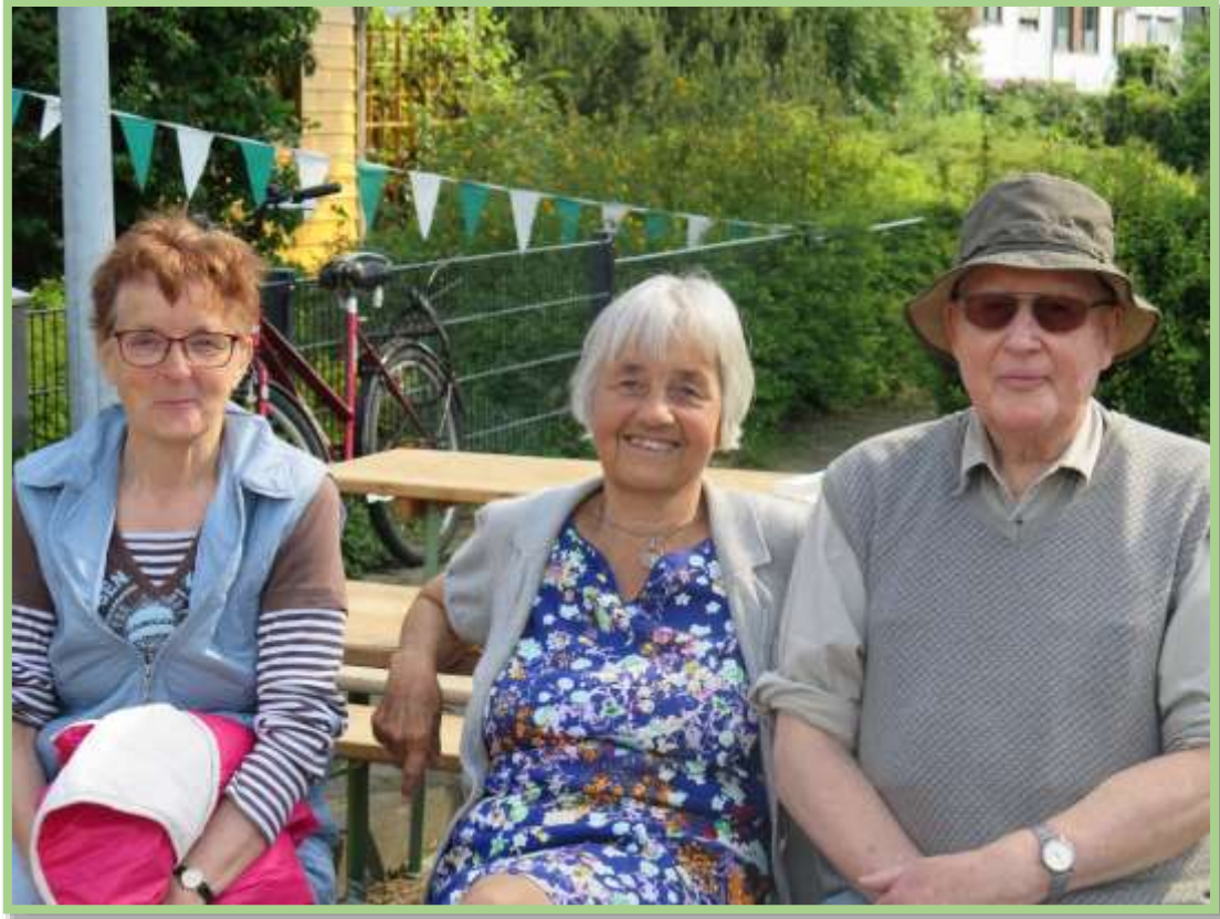
...dort hängen die Schützenfestfähnchen am Haus