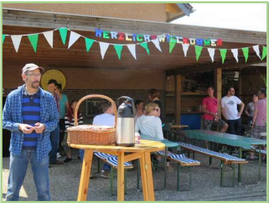
Gäste u. Helfer warten schon auf den Schützenumzug