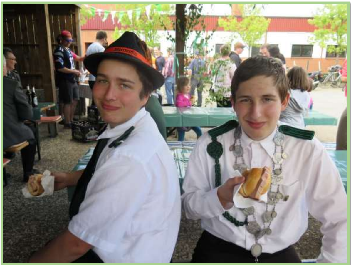
Es gibt leckeren Bayerischen Leberkäs mit Brötchen