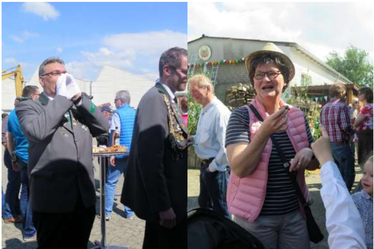
„Heide - wir wollen - los“ !!!