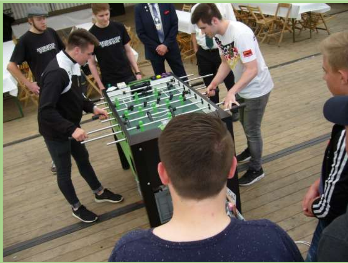
...der Körkelwettkampf eröffnet