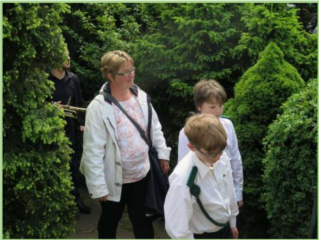
Der Schützenumzug begibt sich...