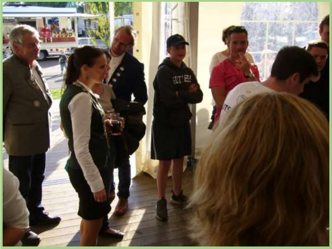
Die Schützen bestaunen...