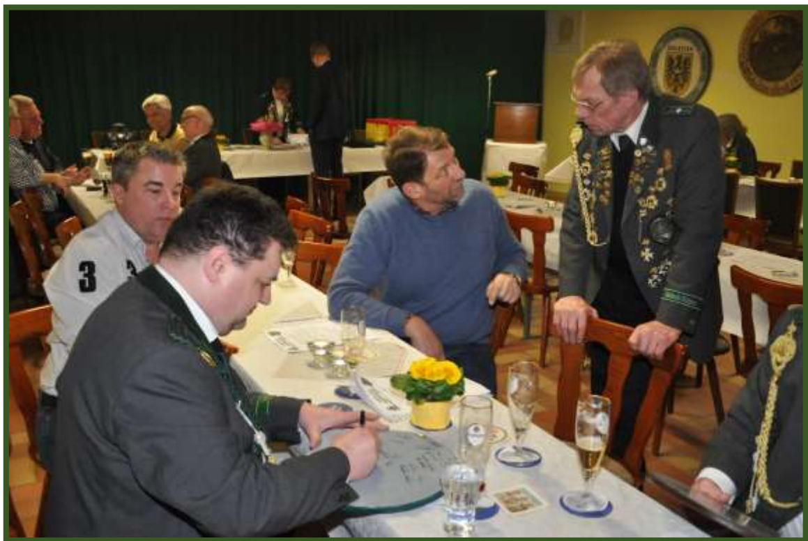
Unterschriften der Schützenbrüder & Schützenschwestern versehen.