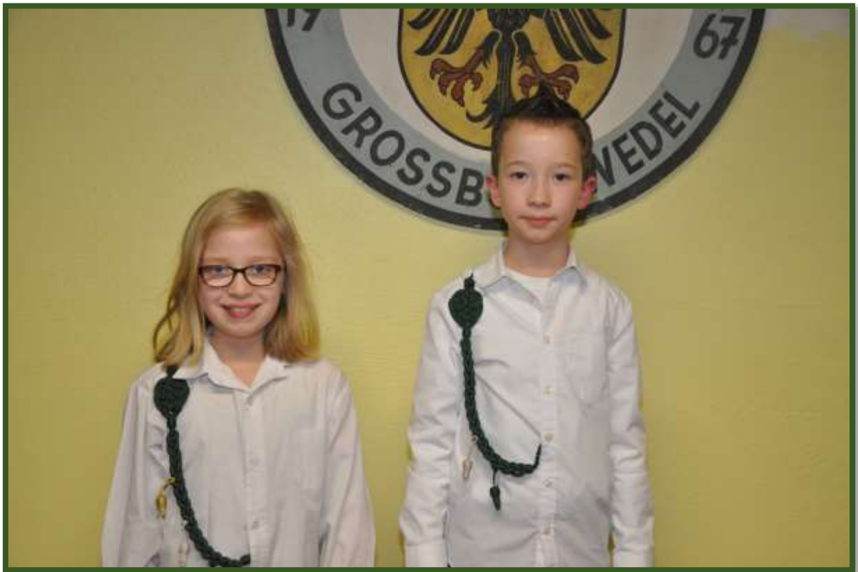
...für erzielte Ergebnisse beim Luftgewehr- u. Lichtpunktschießen