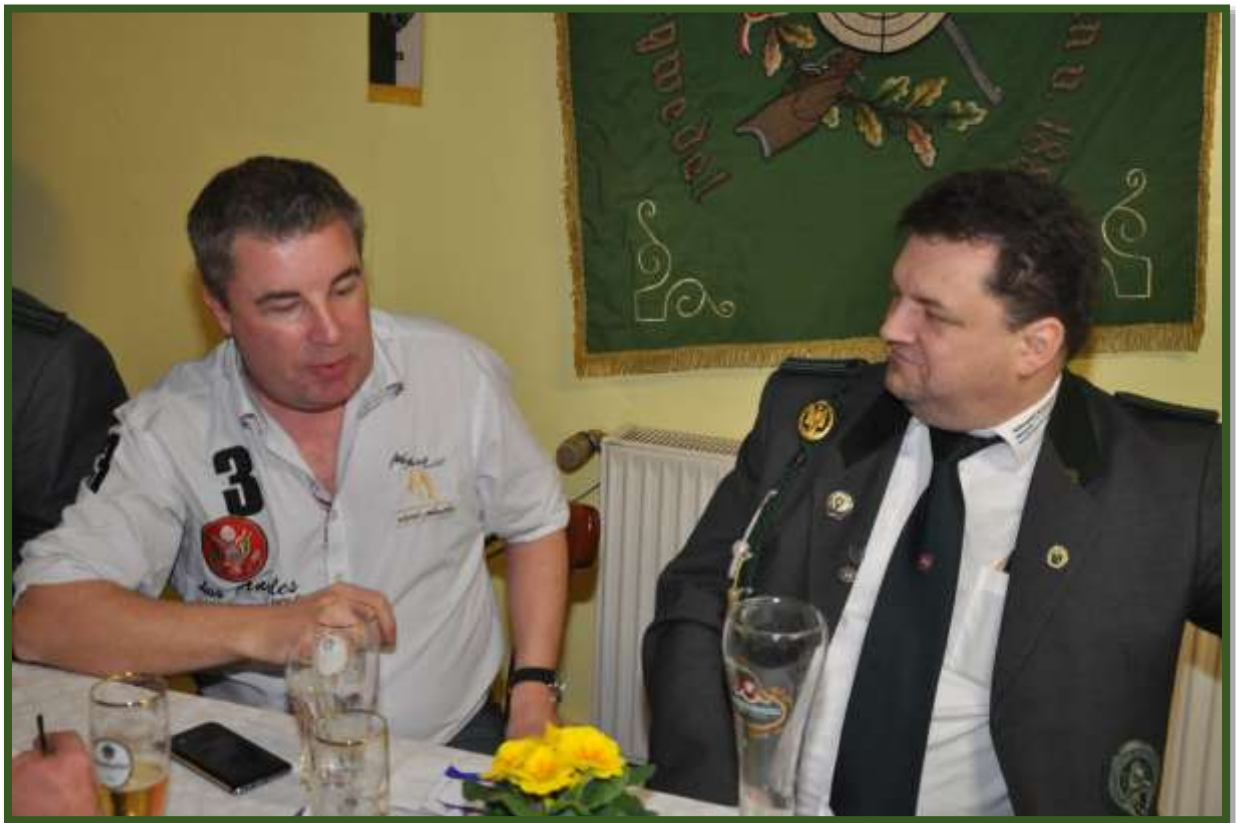
Nach dem Sitzungsende um 22.31 Uhr ging man zum...