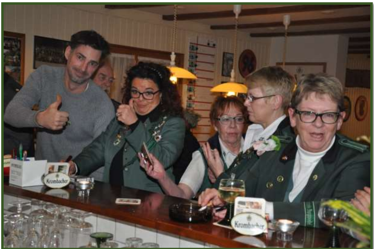
...man führte noch intensive Tresen Gespräche