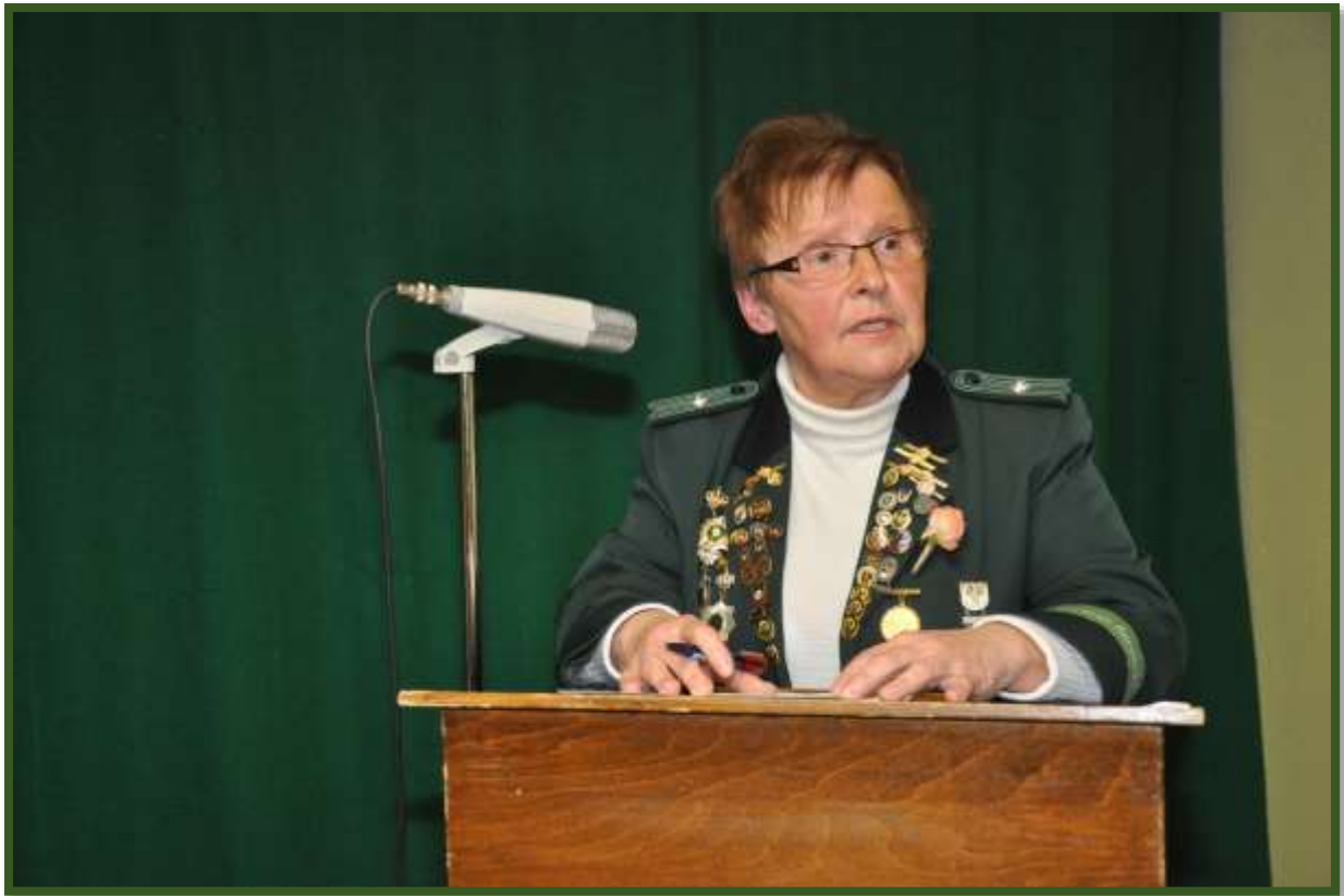
Es wurde der Kassenbericht abgegeben und...