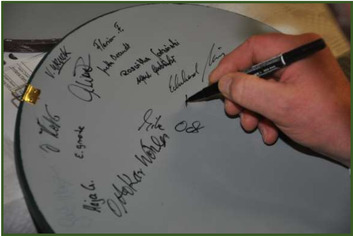
Die Glücksscheiben wurden mit den...