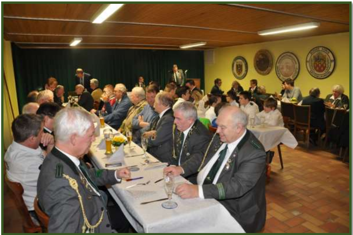
Die Vereinsmitglieder freuten sich schon auf das Essen