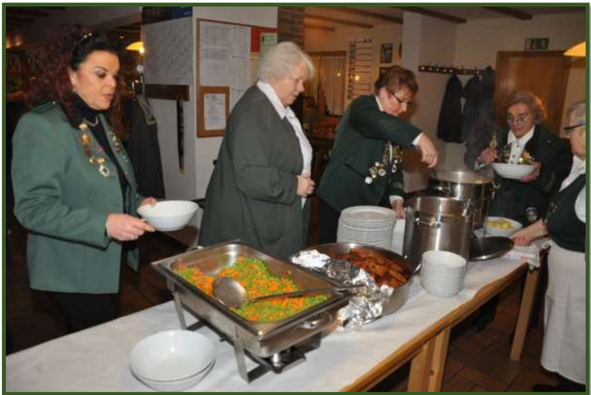
Den Service für die Verpflegung übernahmen unsere Schützendamen