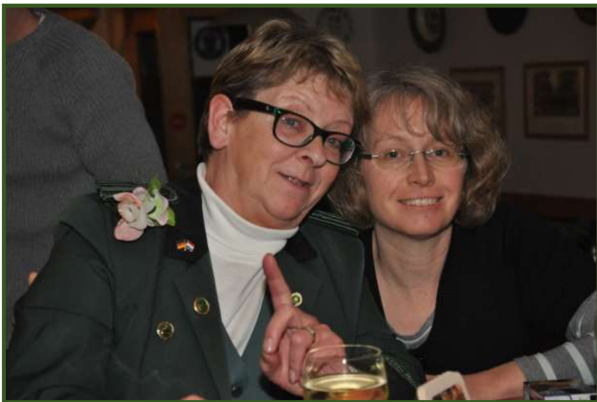
Für den Photographen wird auch noch einmal schön gelächelt