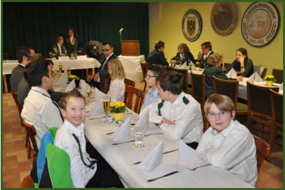
Der Tisch mit den Jugendlichen war gut besetzt