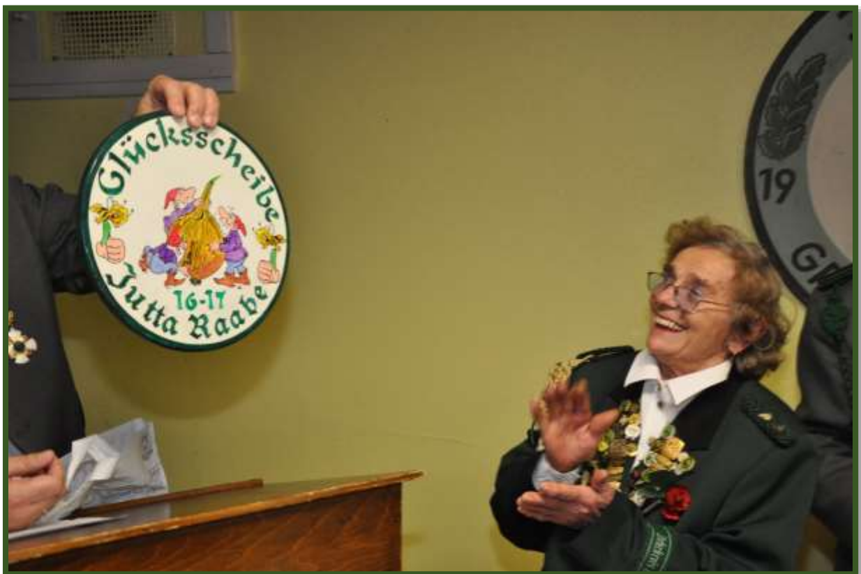
Über die persönlich gestalteten Motive auf den Scheiben...