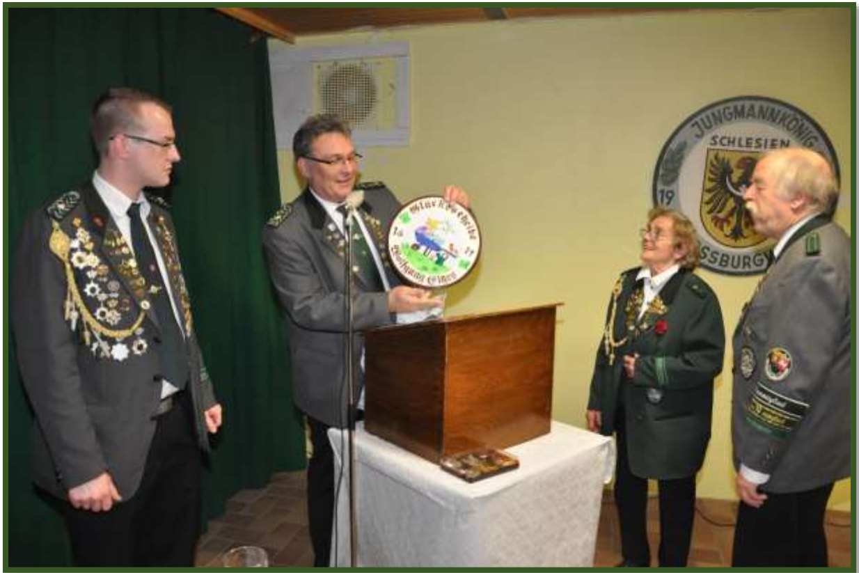
Zwei „Glückscheiben“ wurden ebenfalls überreicht