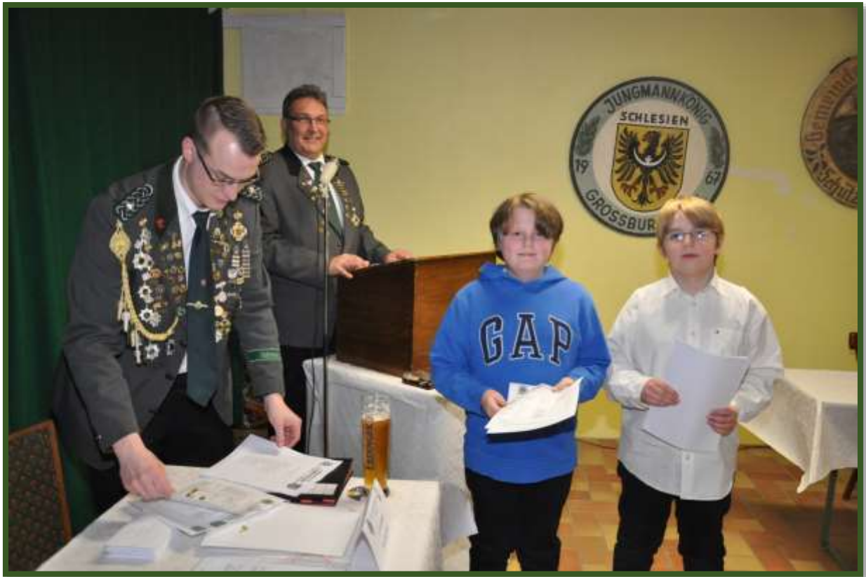
Es wurden neue Vereinsmitglieder vorgestellt...