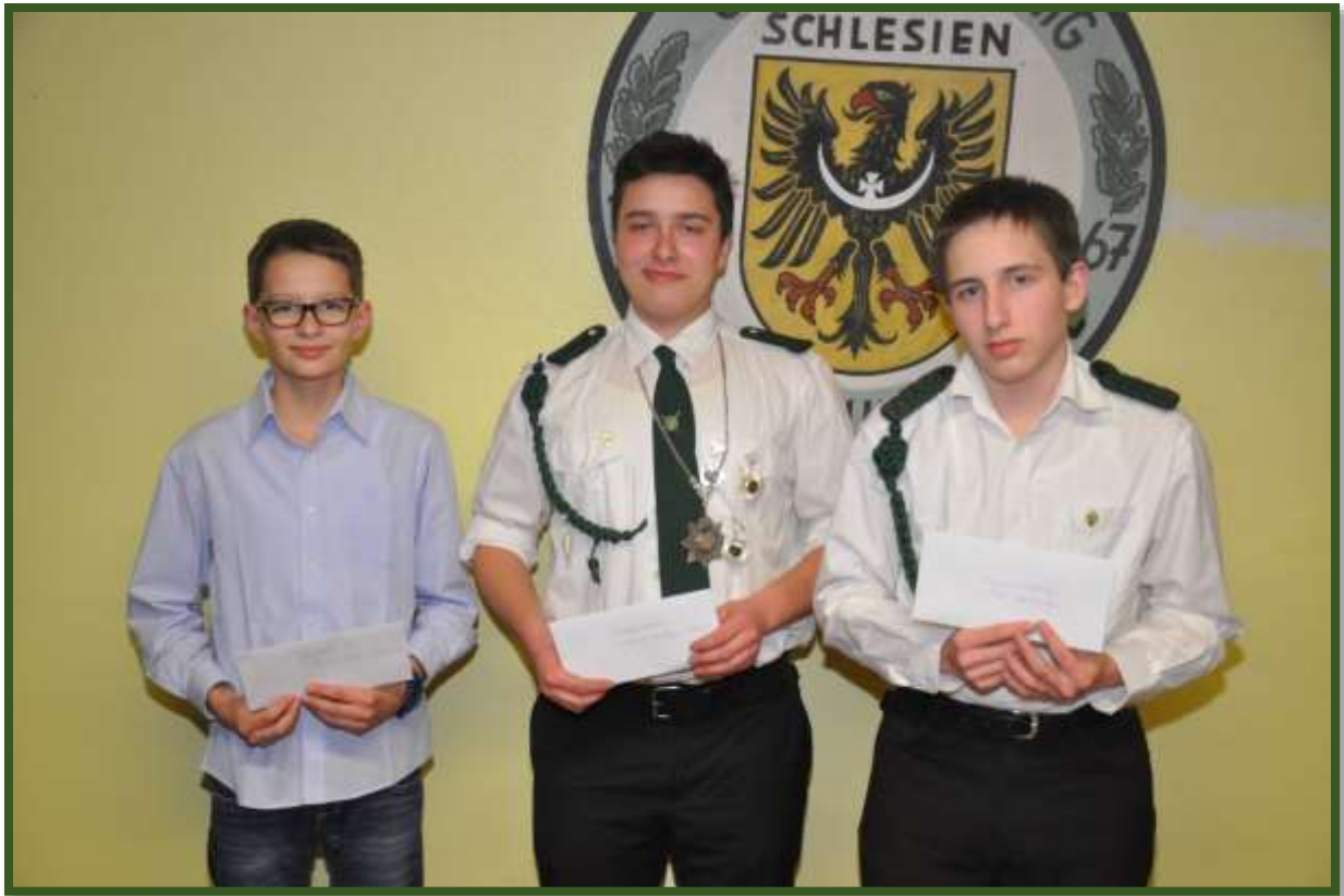
Unsere Jugend bekam Leistungsnadeln...