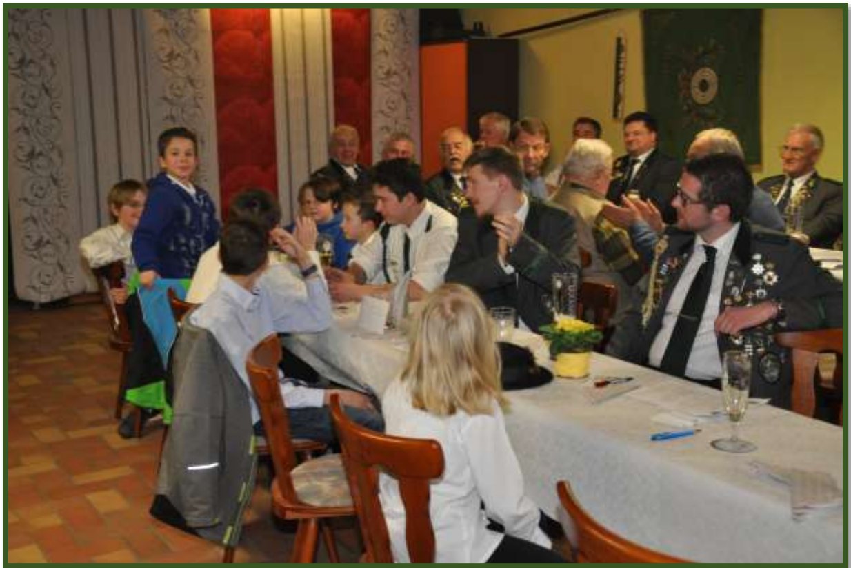
...und freute sich über den personellen Zuwachs im Jugendbereich