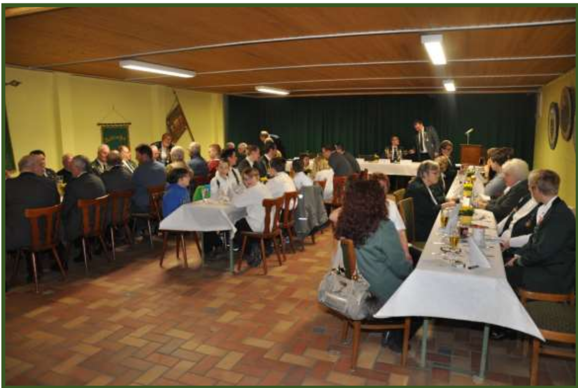
Auch die Damen und Herren hatten inzwischen Platz genommen