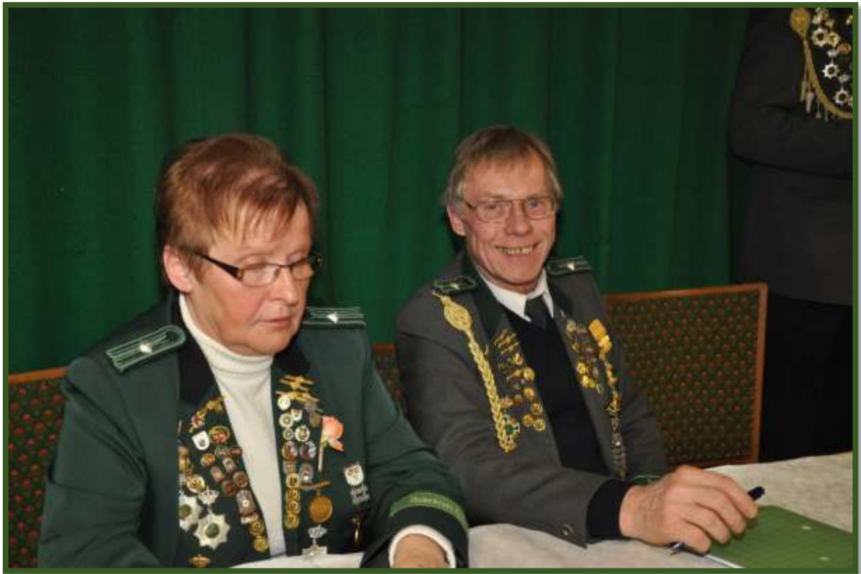
Die Kassenwartin & Der Schießsportleiter