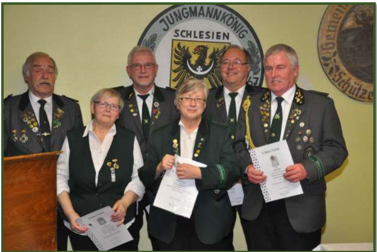
Es wurden Verbandsnadeln für langjährige Mitgliedschaft verliehen