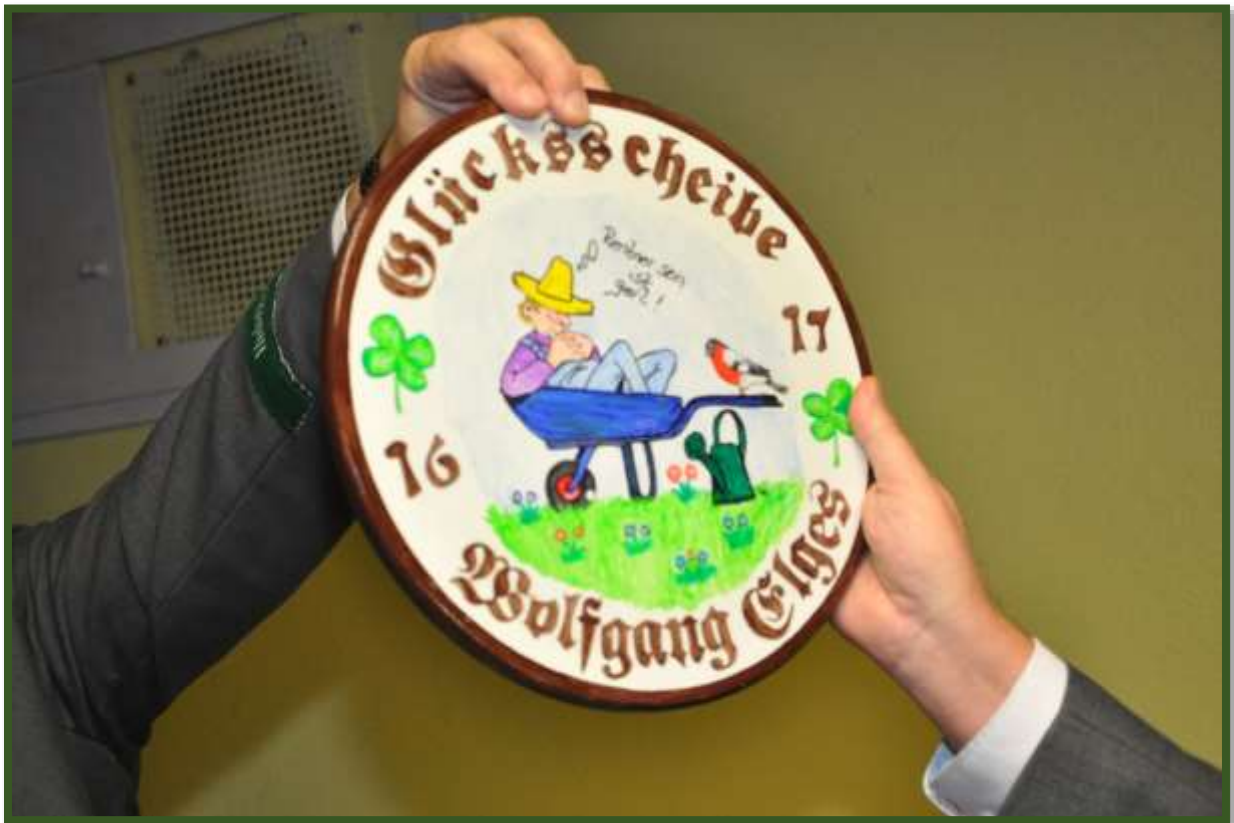
Erstellt wurden Sie von unserem Scheibenmaler...