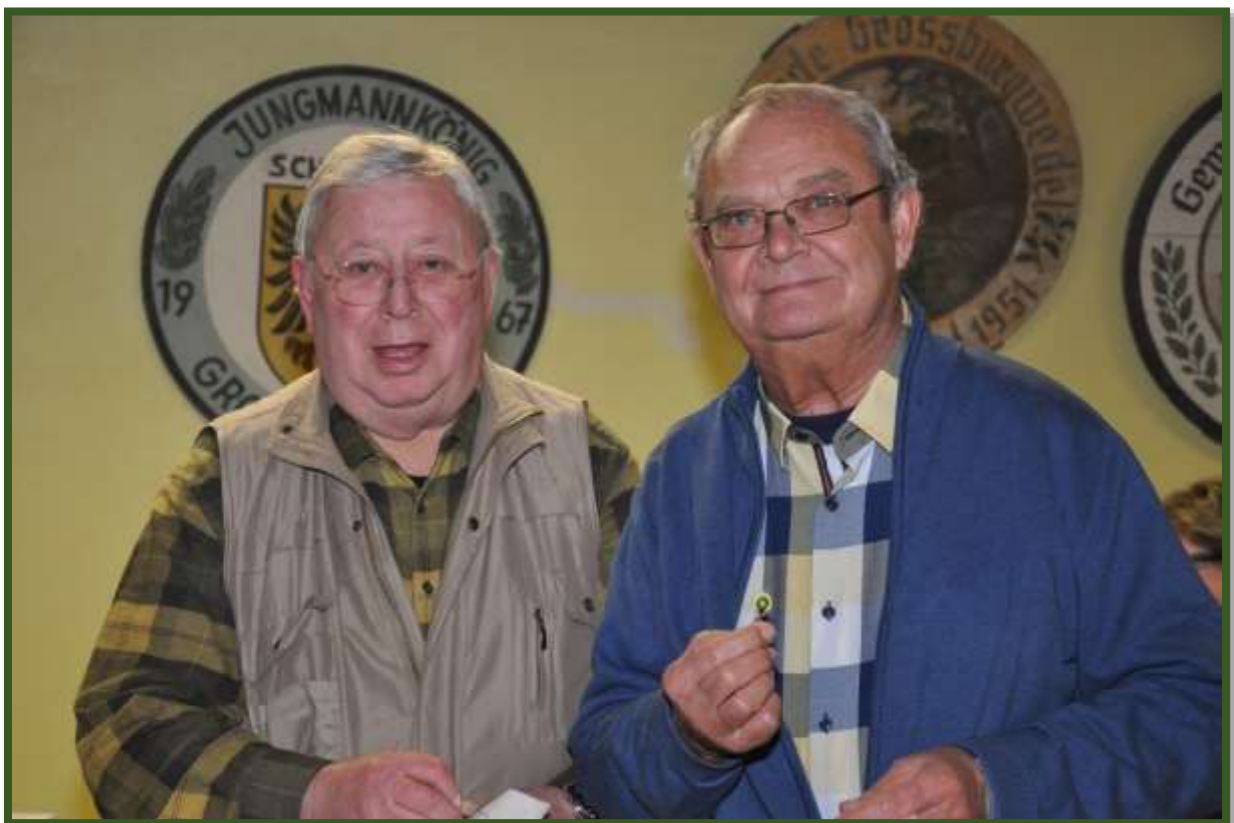
...und ihnen die Vereinsnadel von 1888 übergeben