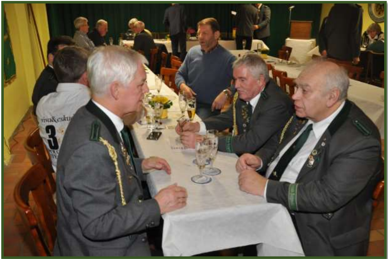
...gemütlichen Teil des Abends über und