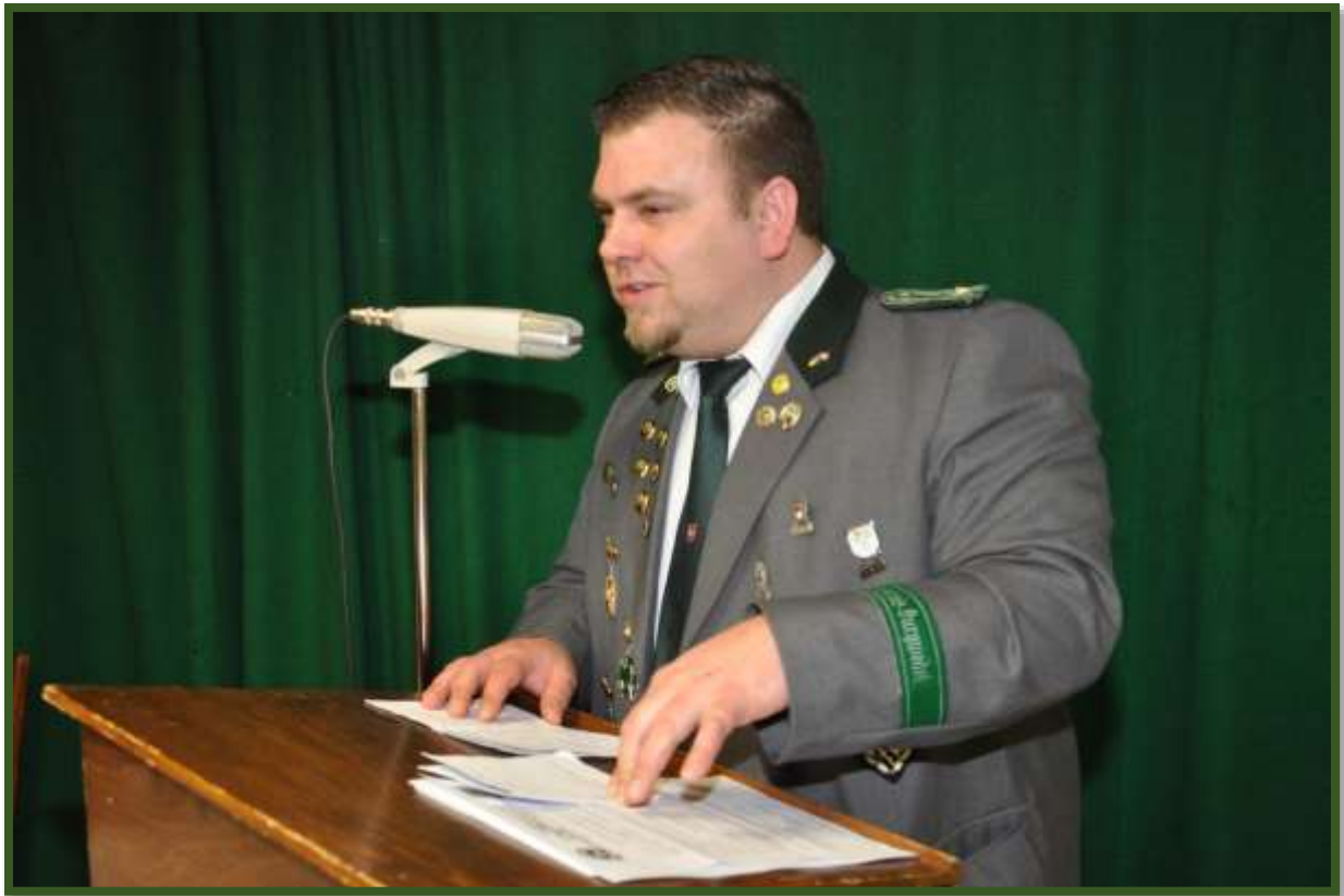
Der Jugendleiter stellte seine erfolgreichen Jugendlichen vor