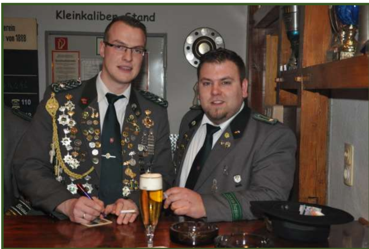
Die JHV wurde kurz für eine Raucherpause und...